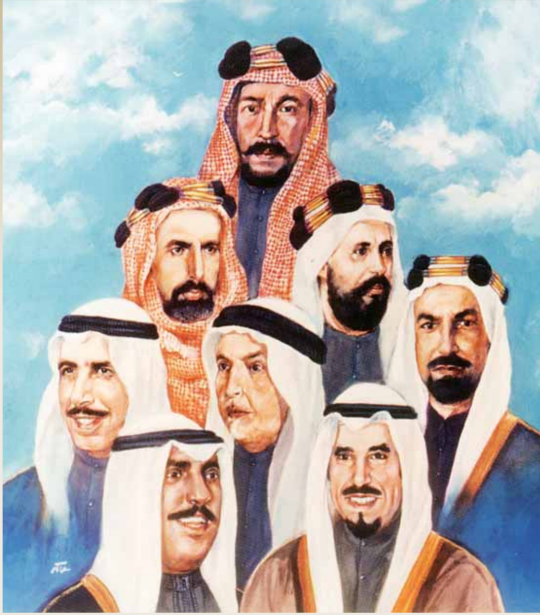
● مبارك الكبير مؤسس دولة الكويت

انطرق إلى الاسباب الحقيقية من وراء هذه المعركة التي اختلف فيها اغلب المؤرخين في تحديد السنة بالضبط، أي السنة التي وقعت فيها المعركة، ولكن هناك أموراً خفية حول حدوث هذه المعركة التي نشبت بين الصباح (الكويتيين) والشيخ بركات (من الكعبيين) لذا وضعت عدة اسباب حقيقية وراء هذه المعركة البحرية التاريخية وبداية نشأة آل الصباح في الكويت، ومن هذه الاسباب: