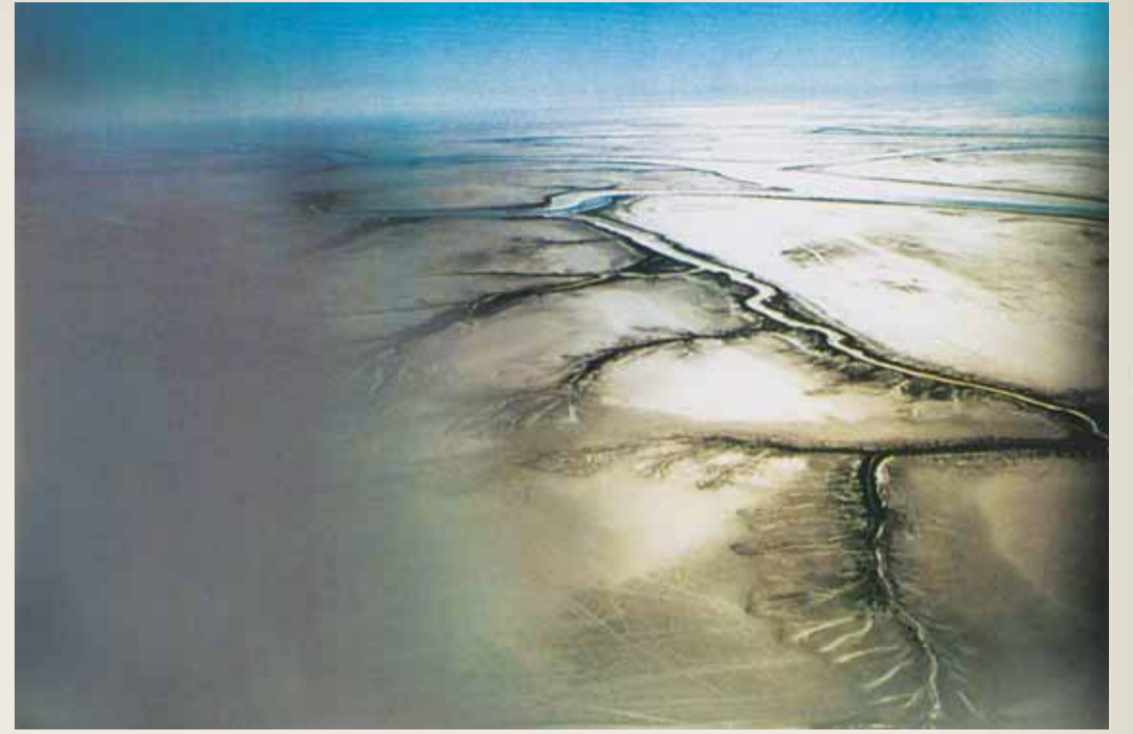
● الرق - الماء في حالة الجزر

لا شك ان الكويت كانت ارضاً بر/ وبحراً في مطلع القرن السابع عشر، كان هناك سكان يعتمدون على صيد الاسماك وعلى ركوب البحر، ومن الجدير بالذكر ان الساحل الشرقي لشبه الجزيرة العربية كان تحت حكم ونفوذ بني خالد الذين دخلوا في صراع مرير مع الحاكم العثماني في منطقة الاحساء وتغلبوا عليه، واصبح هذا الساحل من الكويت شمالاً وحتى قطر جنوباً تحت مظلة حكم بني خالد، بما فيها «القرين» التي هي الكويت، وامر طبيعي ان ينشئ بنو خالد حصناً صغيراً على ساحل القرين ليكون لهم مستودعاً يحفظ فيه الزاد والخيرة، واصبح كوت بن عريعر نواة للدولة المعروفة الكويت، اما نجد فقد اصابها قحط شديد، وتبع ذلك هجرات، بين القبيلة والفينة بحثاً عن الاستقرار والتحديد في القرن السابع عشر، حيث هاجرت جماعة من القبائل العربية في وسط نجد وعند قطر استقرت جماعة تسمى العتوب والمعني عتب أي ارتحل، وهؤلاء جماعة العتوب لهم نبوغ في معرفة امور البحر، ولديهم خبرات بحرية كبيرة، وهذه الجماعة استقرت في بادئ الامر في قطر ونتيجة للخلافات اضطر