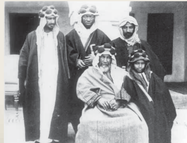
● الصور من الكتب التاريخية

- هاض: كثر ويقال هاض الجراد بلا جيل. - إي كثر الجراد، وهو في موسمه. - هولة: شدة القباحة. - ها الطر: من هنا وهناك. - هببط: واطي ويقال طوفه - ها البوطة: في هذا المكان. - هببطة أي حائط واطي. - هذب: رموش العين. - هببع: نام استرخى - هين: مغاصات اللؤلؤ. - هوجس: يفكر بالشيء - هال: اغدق بسخاء ويقال هيل. - هلبد: وضع الشيء فوق بعضه